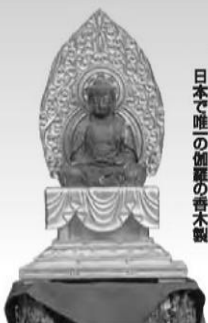
浜屋御本尊 日本で唯一の加藤の青木観

〈問合せ〉兵庫教区教務所内 兵庫教区布教団事務局 (電話) 078-341-5949